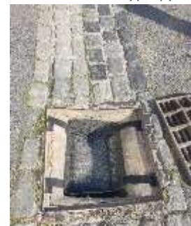
Exemple de panier Avec fond adsorbant 1

Les paniers sont disponibles pour tout type d'avaloir du marché. Ils sont conçus pour ne pas entraver le passage des eaux, et ne génèrent pas plus de colmatage que lorsque les avaloirs ne sont pas pourvus de ces paniers. Selon les fréquences et les habitudes de maintenance un budget est à prévoir mais qui diminue d'autant la maintenance plus conséquente d'ouvrages en aval (types dégrilleurs, bacs à graisses, exutoires etc.). Généralement le dispositif en place génère un gain par rapport aux solutions existantes, quand elles existent.