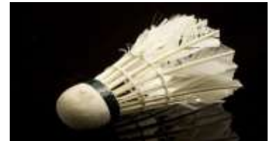
Volant plume usagé

Ceci est notre premier gisement disponible mais pas le seul bien entendu.