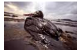
Volatile englué lors d'une marée noire

Le panier permet la récupération des flottants et le fond adsorbe les hydrocarbures. En effet tout comme sont les oiseaux premières victimes des marées noires, dont les ailes s'engluent de pétrole, les plumes sont constituées de kératine bêta et vont adsorber les hydrocarbures avec une cinétique remarquable.