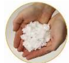
Polypropylène en flocons vrac

Contrairement aux produits généralement utilisés pour résorber les pollutions d'hydrocarbures, qui sont majoritairement basés à partir de polypropylène, donc pétrosourcés (on absorbe du pétrole avec du pétrole !) eux même polluants, nos absorbants naturels ne comportent pas de plastique qui se retrouve en nanoparticules dans les océans.